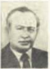
ANDRZEJ GAJDA 1 września 1952 r.